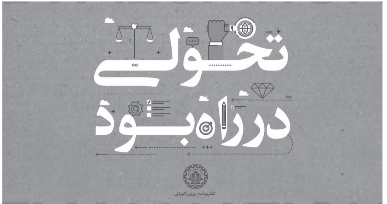
دفتر برنامه ریزی راهبردی

بررسی‌ها بارها به مسئولین دانشگاه گفته شده است؛ اما امیدواریم که دانشجویان نیز با دانستن آن‌ها خود برای اصلاح مشکلات راه‌حل باشند.